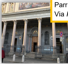
Parr. S.GIOACCHINO Via Pompeo Magno, 104

El viernes las conferencias serán en 6 idiomas (inglés, español, italiano, portugués, francés y polaco). Habrá 6 sitios disponibles para ello.