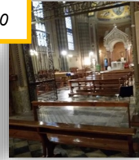
S. Spirito in Sassia (Santuario della Divina Misericordia) Via dei Penitenzieri, 12