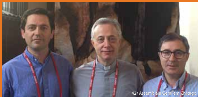
42ª Assembleia Geral em Chicago