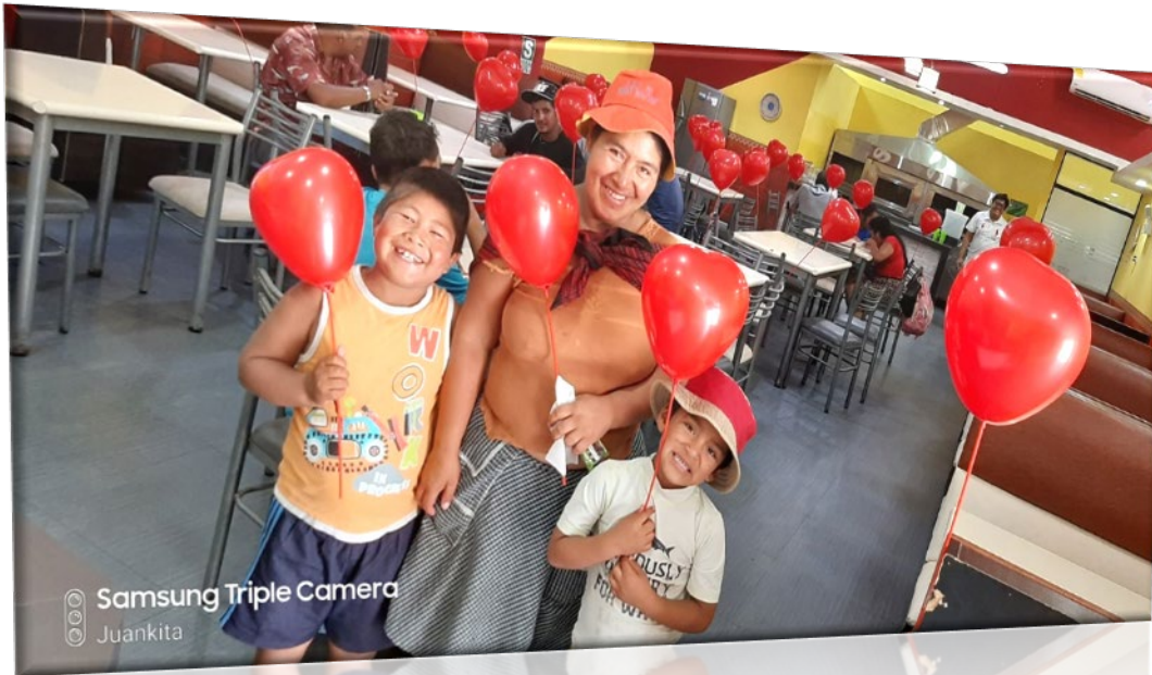
Amigos nuestros satisfechos con la atención y la celebración de las fiestas.