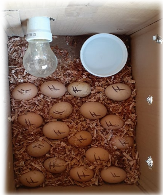
Primer emprendimiento casero para la reproducción de aves de corral. Incubadora casera