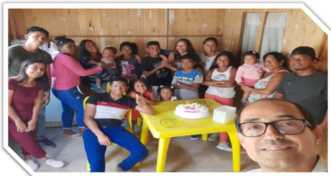
La importancia de celebrar juntos los cumpleaños