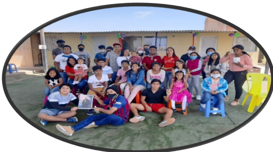
Aprovechamos al máximo las oportunidades para celebrar acontecimientos de importancia