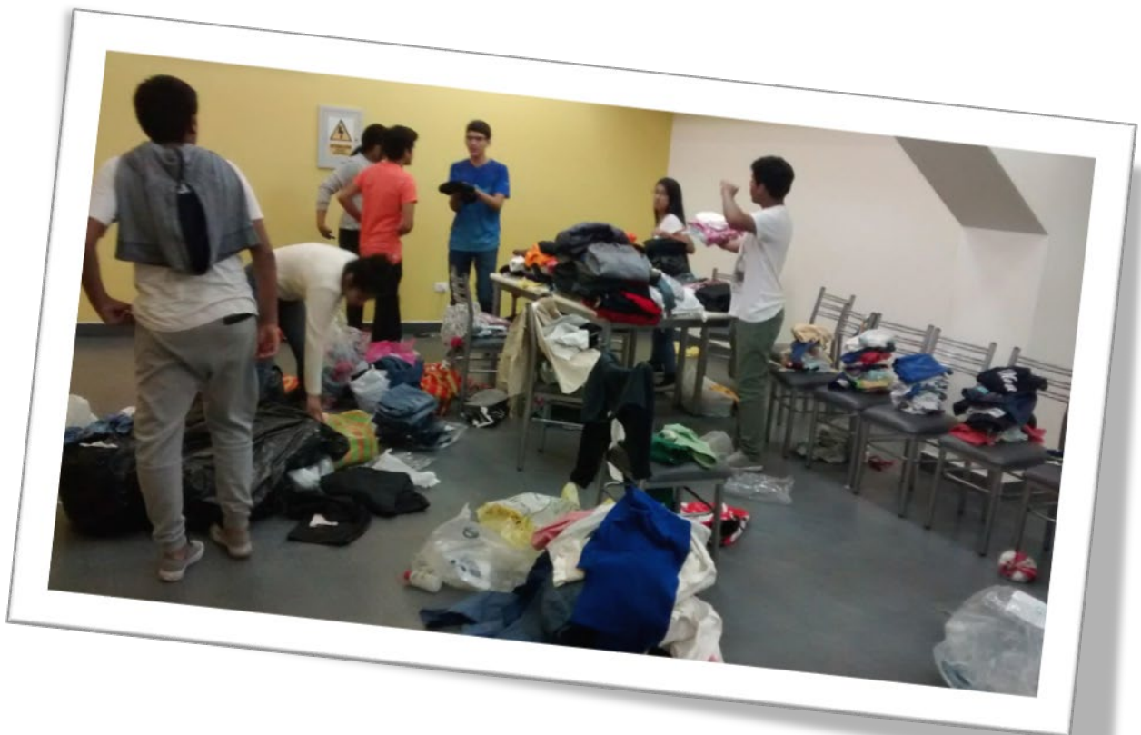
El trabajo de nuestros voluntarios en la selección y clasificación de la ropa donada