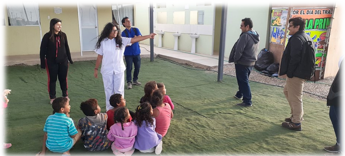
Voluntarios psicólogos en intervención lúdica grupal con los niños de la Villa

Conjuntamente con la Comisión Diocesana de Movilidad Humana, con quien también hemos establecido una alianza estratégica, se prepara la implementación del Refugio temporal como Casa de Acogida, exclusiva para mujeres y sus hijos en situaciones de vulnerabilidad por el tiempo necesario hasta su restablecimiento e integración a la comunidad.