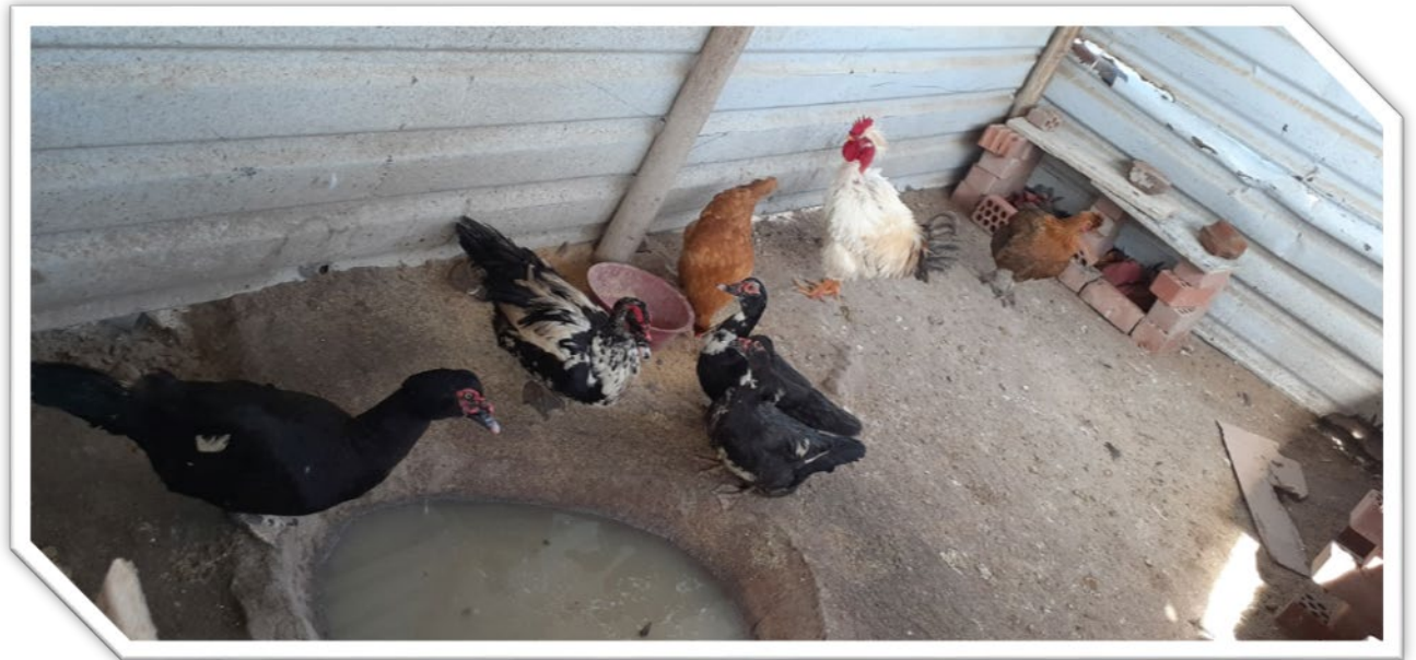
Corral de aves reproductoras