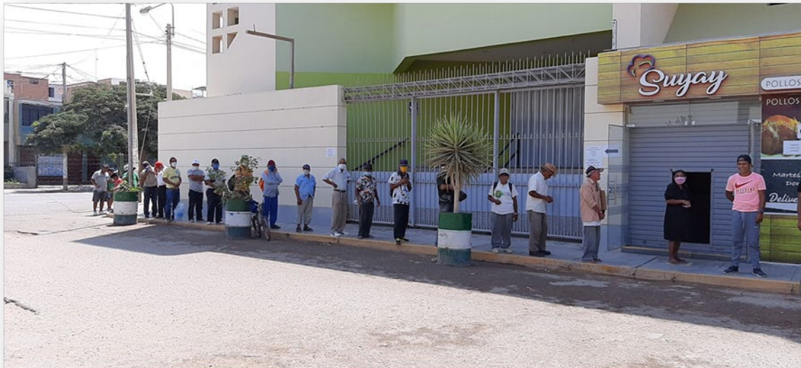
En tiempo de pandemia covid19 llegamos a atender a más de 150 personas diarias, siempre con el respeto de las normas de prevención.