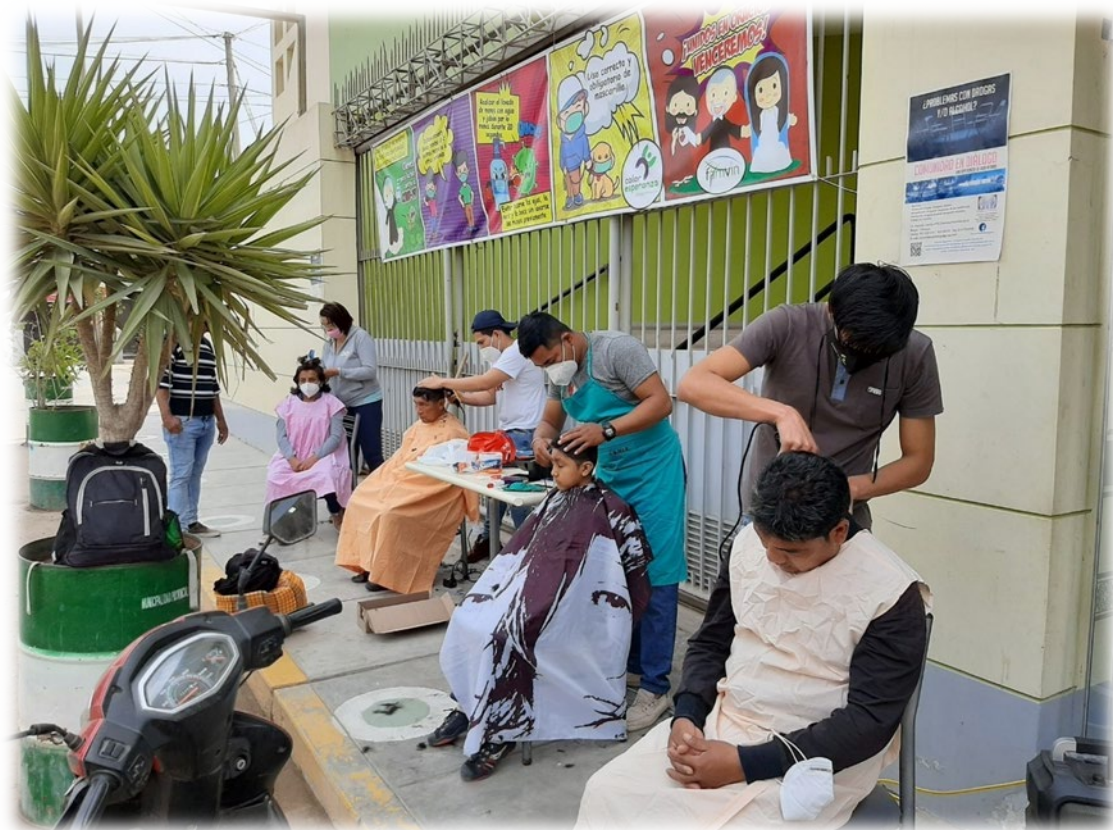
Proyección social en actividades de bienestar y salud mental