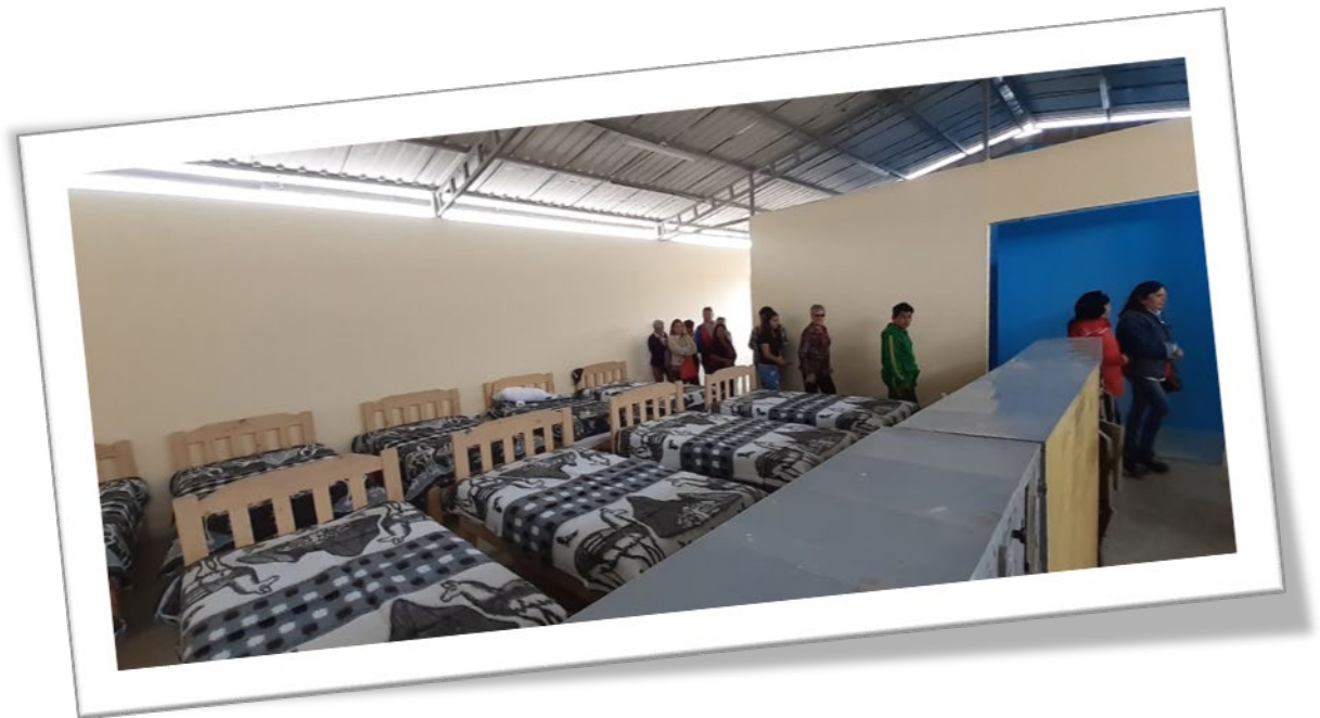
Refugio temporal debidamente acondicionado para albergar a los hermanos migrantes