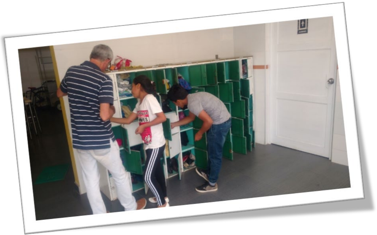
El ropero constantemente se abastecía de prendas de vestir para nuestros socios asistidos