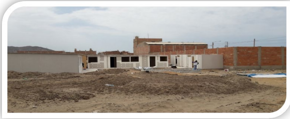
Construcción de las 4 casas donadas por la Congregación de la Misión