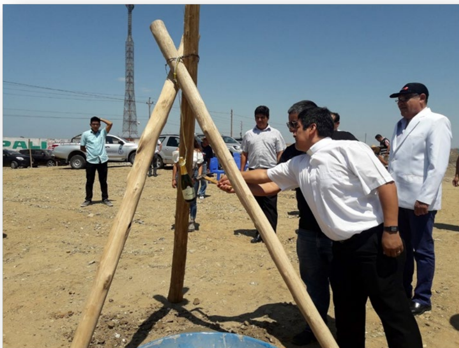
Colocación y bendición de la primera piedra del proyecto Mitso Esperanza