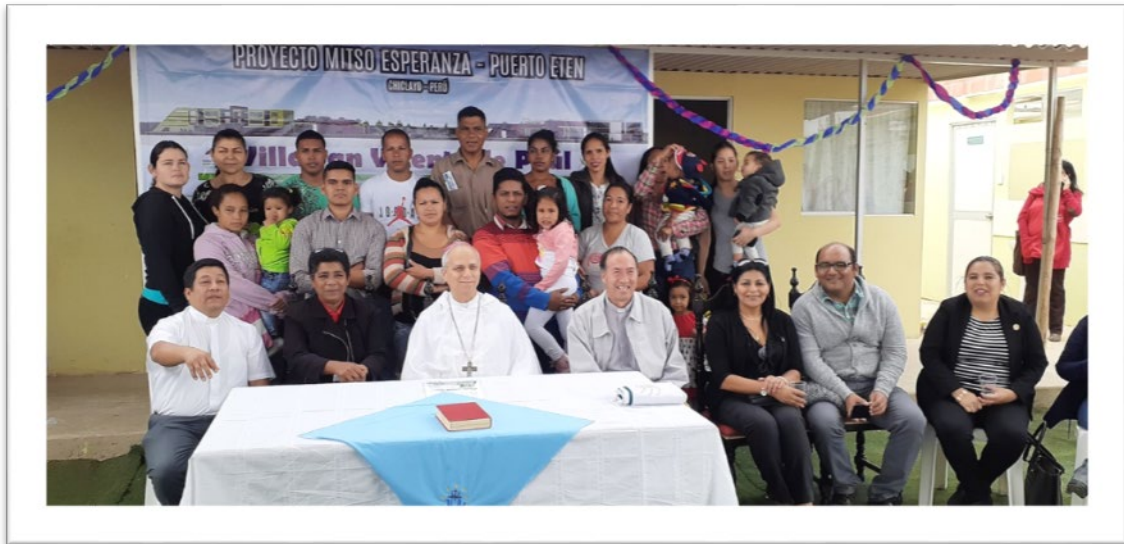
Autoridades e invitados a la ceremonia de inauguración y bendición de los ambientes.