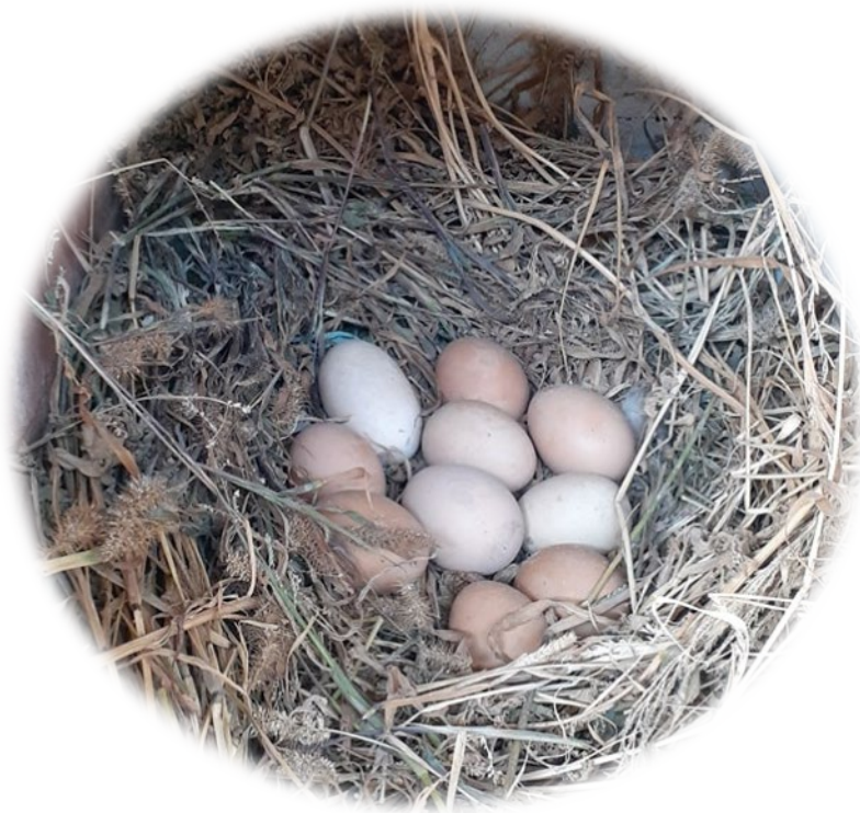
También buscábamos la reproducción natural de las aves en sus nidos