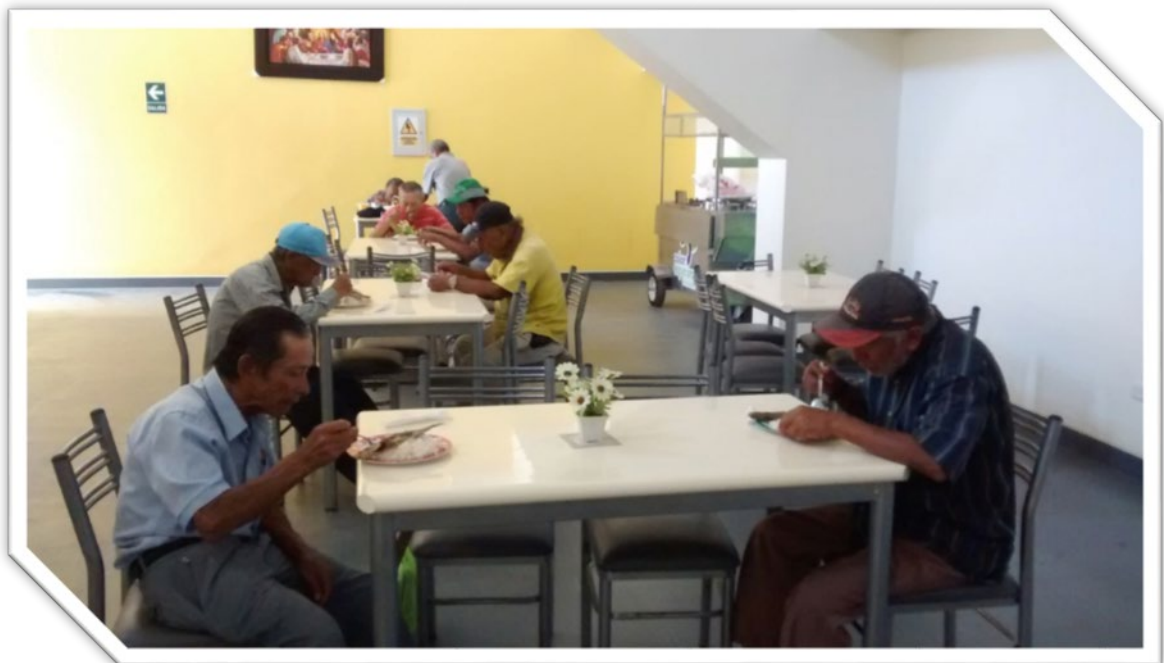
La asistencia en un inicio fue para personas en situación de calle y/o abandono.