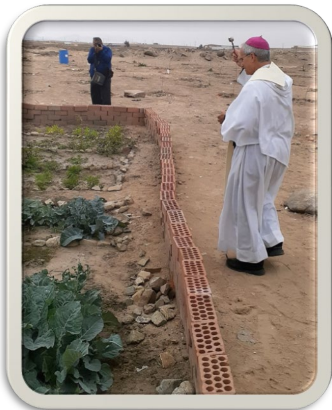
Bendición de los frutos del primer proyecto del biohuerto