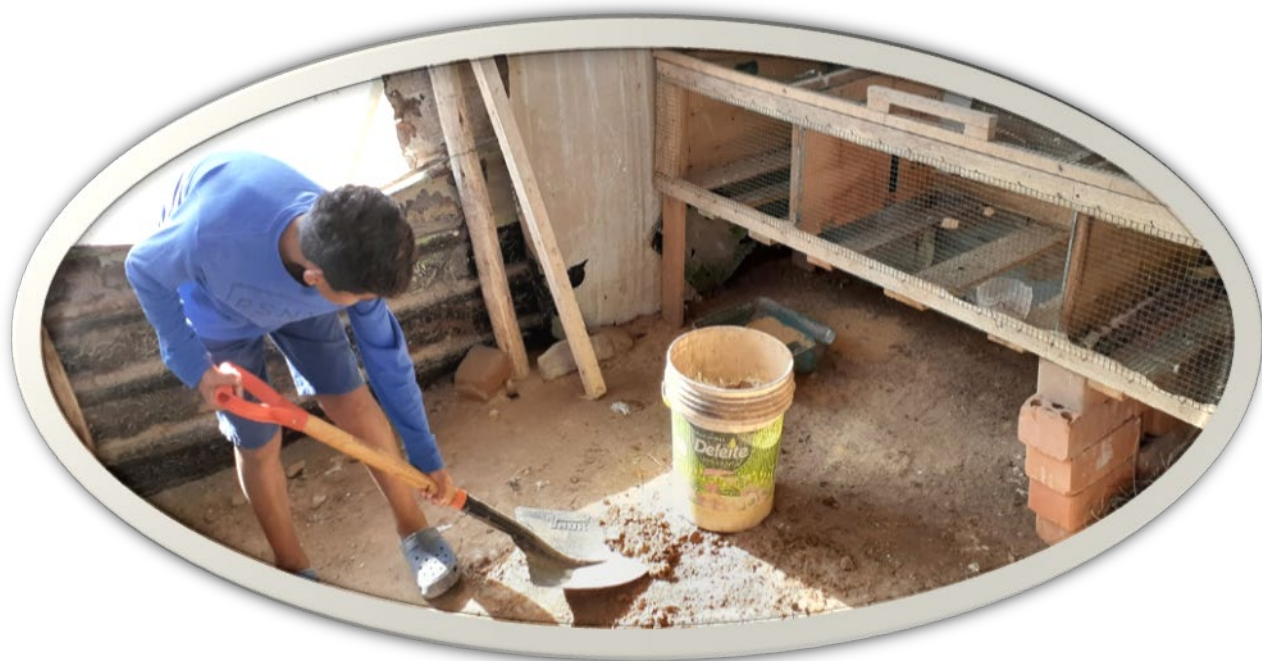
El compromiso en el mantenimiento de estos emprendimientos es de todos los habitantes y refugiados de la Villa