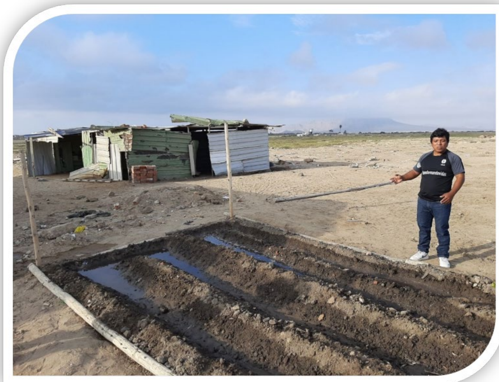
Segundo proyecto de biohuerto