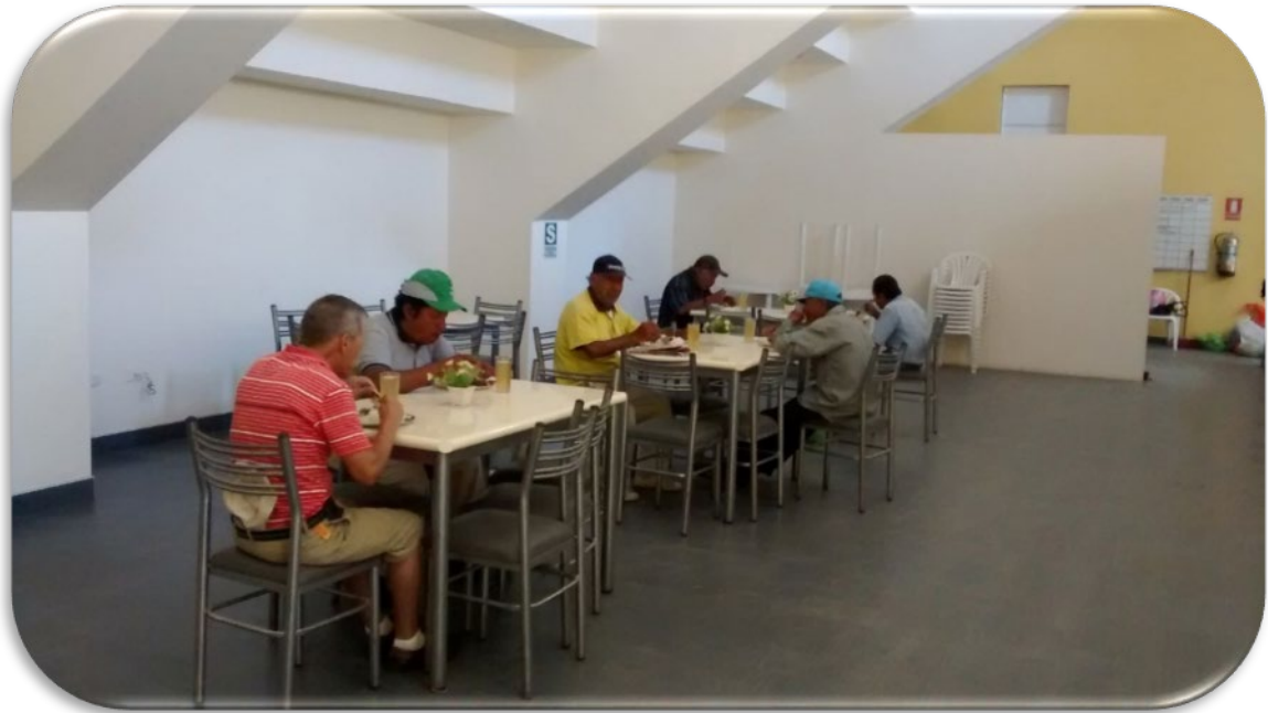
Nuestro comedor en sus inicios.