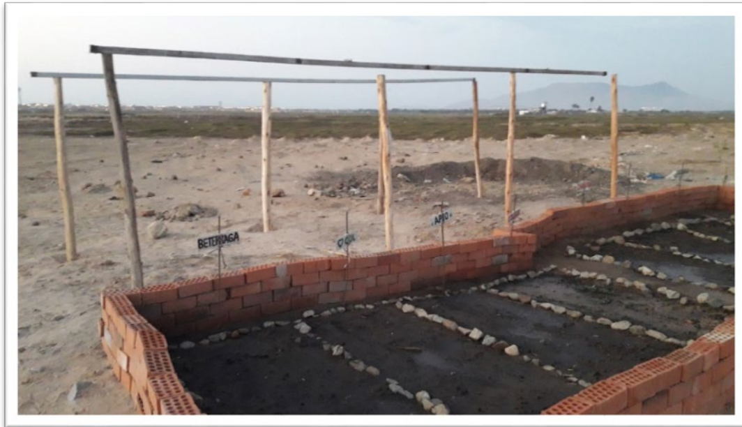
Primer proyecto de biohuerto

Con la ayuda de Voluntarios y considerando la necesidad de la promoción de la persona e inclusión en el mundo laboral como instrumento de auto sostenimiento en la generación de los propios recursos y posibles puestos de trabajo; se inició con la etapa, a nivel principiante, de los emprendimientos consistentes en la crianza de aves de corral y cuyes y también en la construcción de biohuertos, facilitándoles el acceso al empleo y promoviendo el acompañamiento técnico para la inserción al mercado laboral y para el emprendimiento.