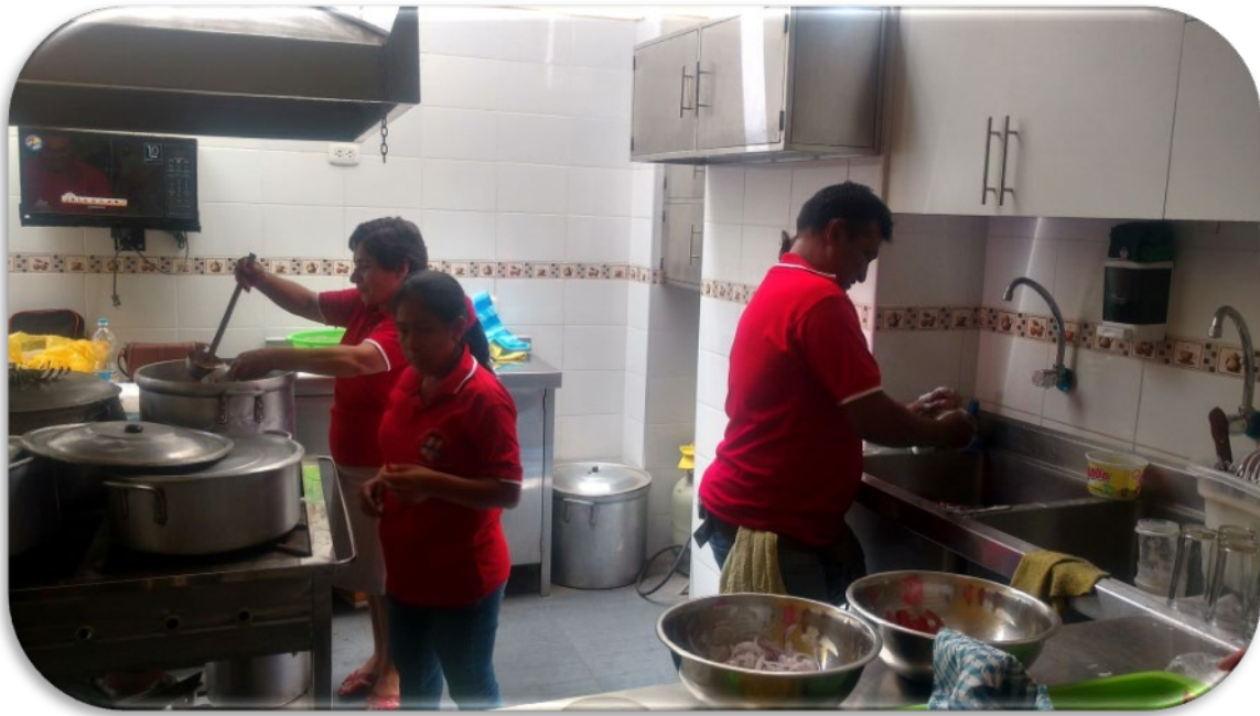
Familias y amigos voluntarios también donaban su tiempo para preparar los alimentos