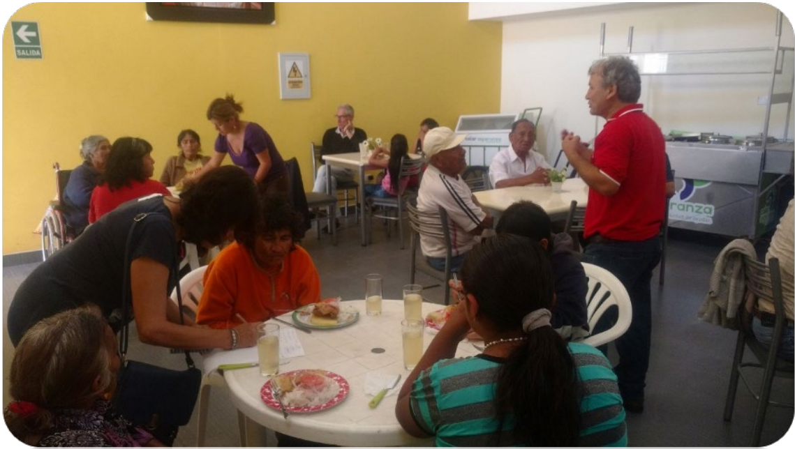
Muchos voluntarios "COLOR ESPERANZA" han brindado y brindan su tiempo en este lindo servicio