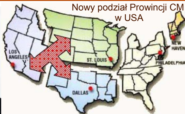
Nowy podział Prowincji CM w USA