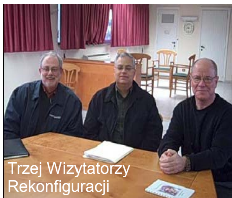
Trzej Wizytatorzy Rekonfiguracji